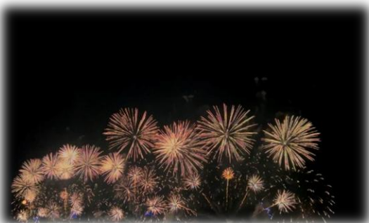
【松江の夏祭り・水郷祭】