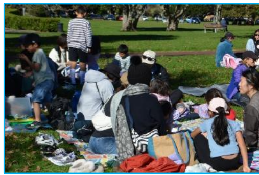
親子で楽しく、お弁当タイム

それから、午後の活動では、まず「親子工作」を行いました。内容は「かざぐるま」と「ブーメラン」の2種類です。2つの場所に分かれてから、教師の説明を聞いた後に、工作開始です。それぞれ、親子で協力して作り上げた後は、広い芝生の上で、それらを使って思いっきり楽しみました。