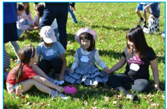
もうじゅうがりゲーム「グループ作り」

それらの活動の後は、遠足のもう一つのお楽しみ「お弁当」です。それぞれのご家族が一緒になって、楽しいひとときを過ごしている様子が印象的でした。