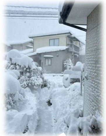
【雪がたくさん積もります】