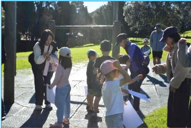
オリエンテーリング「親子でジャンケン」

初めに、挨拶と準備運動を行った後、オリエンテーリングを行いました。今年は、6つのチェックポイントで待っている教職員が出す課題をクリアし、「ひらがな」を集めるゲームでした。チェックポイントを回った後に、地図に書き込んだ6つのひらがなを並べ替えて言葉を作りましたが、答え合わせでは、全員が正解の「みんなえがお」を当てることができ、大喜びでした。