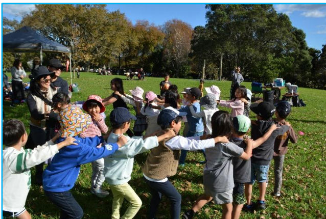
ジャンケン列車「先頭はどこかな？」

そして、遠足の最後には、「ジャンケン列車」を行いました。「線路はつづくよ、どこまでも」の音楽に合わせて行進し、音楽が止まったらジャンケンをします。最初は子供たちだけでゲームをし、その後、保護者の皆さんからも参加していただき、会場全体が盛り上がった中で活動を終わりました。