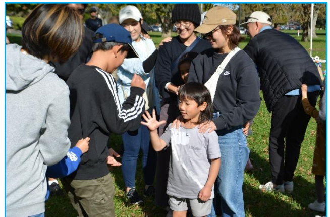
ジャンケン列車「大人も一緒に！！」

遠足の終わりに、子供たちに「何が楽しかったか」を尋ねると、「全部。」と答える子が多く、とても充実した親子遠足ができたのではないかと感じられました。